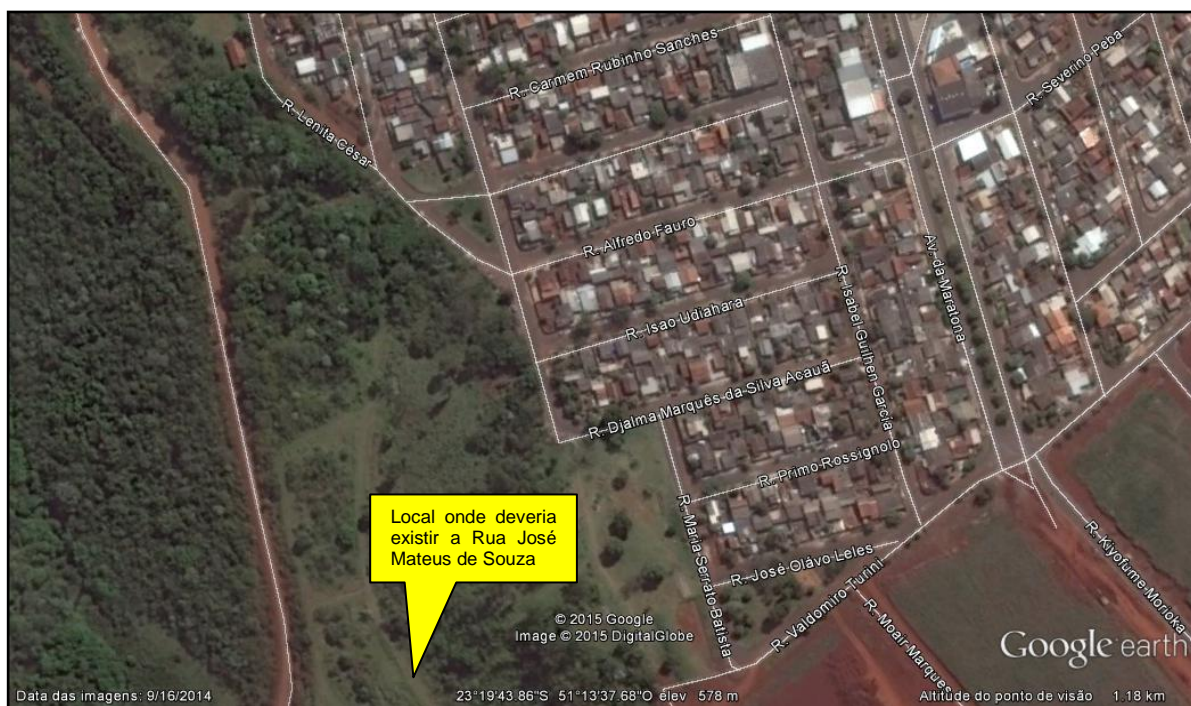
FOTO DA ÁREA

Fonte: Instituto de Pesquisa e Planejamento Urbano de Londrina - IPPUL